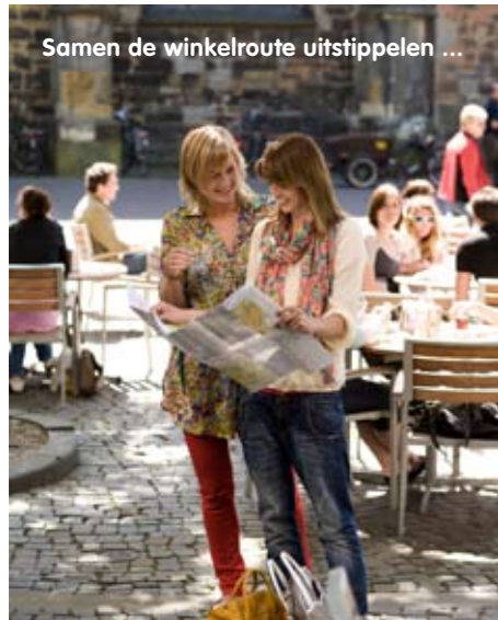
Samen de winkelroute uitstippelen ...