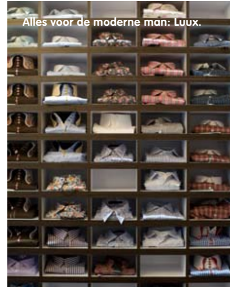
Alles voor de moderne man: Luux.

winkelcentrum De Klanderij, met zijn spectaculair hoge lichtkoepel. Wie dacht dat je in Enschede niet eigentijds kon winkelen, moet maar 's rondkijken bij de vijftig winkels in dit winkelparadijs, zoals die van Rituals en Villa Happ. Ver lopen naar het overige winkelgebieden is het niet, want we zitten pal aan het moderne H.J. van Heekplein met onder meer De Bijenkorf, V&D en alle denkbare filialen. Punto Pasta is in korte tijd uitgegroeid tot een populair lunchadresje. Je krijgt bij binnenkomst een betaalpas waarop vervolgens de vers bereide panini's en pasta's worden bijgeschreven. Kosten? We tikten € 5,95 af voor een tonijnsalade en € 3,50 voor een minipizza met beleg naar keuze.